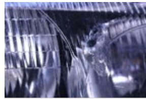
Gat in het glas