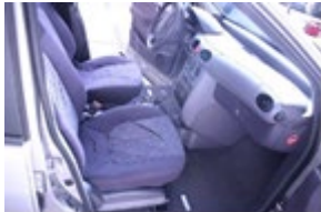
Scheuren en krassen in bekleding